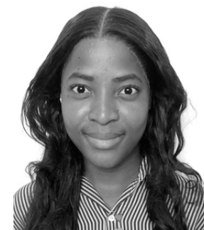
Victória Kúpia Comercial